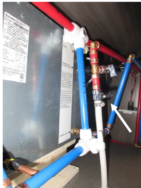
PHOTO D-13 valve D